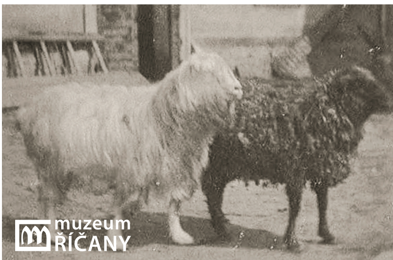
ZEMĚDĚLSKÉ PRÁCE V OKOLÍ OLIVOVNY, ZAČÁTEK 20. STOLETÍ